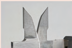
Keményfém betétes mérőfelület